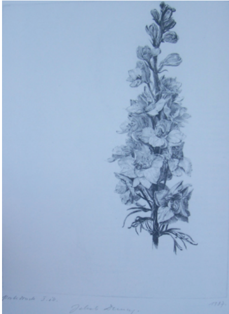
Afbeelding 7 , Demus 153. "Garden Delphinium, delicately shaped"