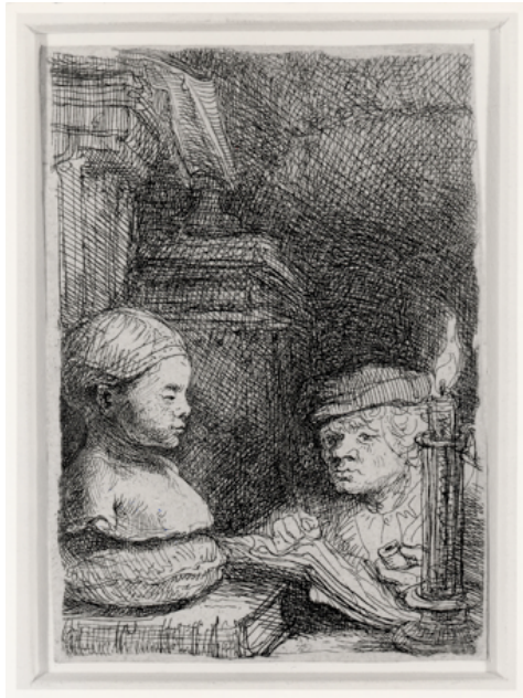
Afbeelding 4 Leerling tekenend bij kaarslicht; ca. 1641, Ets, 94 x 64 mm Museum Het Rembrandthuis, Amsterdam(B130, staat II/3)