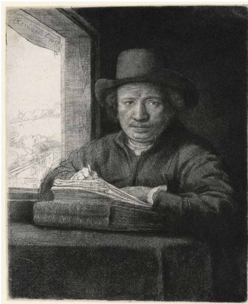
1. Rembrandt, Zelfportret, schetsend bij het raam , 1648 (dia 2 en 3)