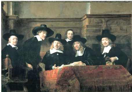
Rembrandt, 'De Staalmeesters', 1662, doek, 191 x 279 cm. Rijksmuseum, Amsterdam

1661 Rembrandt maakt een groot schilderij voor het nieuwe Amsterdamse stadhuis: De samenzwering van Julius Civilis . De burgemeesters zijn er niet tevreden over.