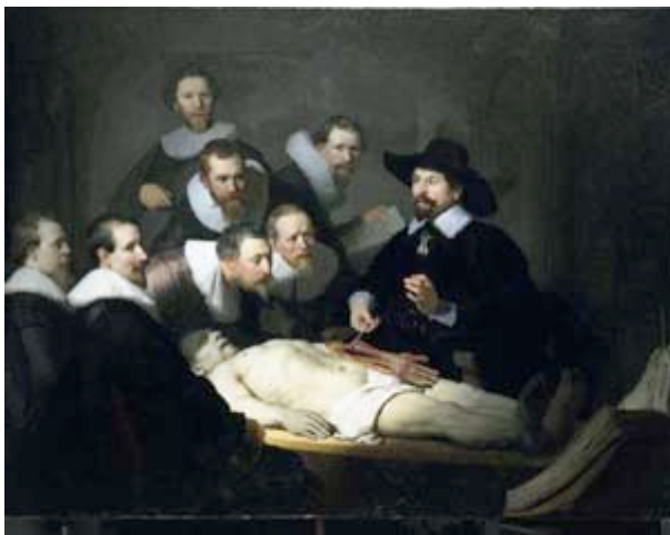
Rembrandt, 'De anatomische les van dokter Tulp', 1632, doek, 162,5 x 216,5 cm. Mauritshuis, Den Haag

1632 Rembrandt logeert bij Hendrick Uylenburgh en schildert zijn eerste groepsportret: De anatomische les van dokter Tulp .