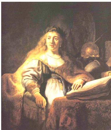
Rembrandt, 'Minerva', 1635, doek, 137 x 116 cm. Particuliere collectie

Aan het begin van zijn carrière schilderde Rembrandt vooral heel precies en gedetailleerd met een fijn penseeltje. Maar hij leerde zichzelf ook vlot te schilderen met een breed penseel. Hij schilderde snel en trefzeker tegelijk. De voorgestelde stoffen en materialen, bijvoorbeeld van een bontmantel of een gouden helm, zien er van een afstand heel echt, glinsterend en zelfs tastbaar uit. Van dichtbij zie je alleen maar driftig met het penseel neergezette hoopjes verf.