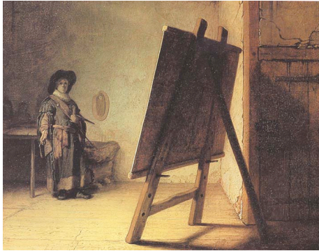
Rembrandt, 'De schilder in zijn atelier', ca. 1628, paneel, 24,8 x 31,7 cm. Museum of Fine Arts, Boston

In de tijd waarin Rembrandt een atelier in Leiden heeft en zijn eerste leerlingen krijgt (onder wie de later beroemd geworden Gerrit Dou), maakt Rembrandt dit schilderij van een jonge schilder die voor een schildersezel staat. Zou Rembrandt zijn eigen atelier hier hebben afgebeeld?