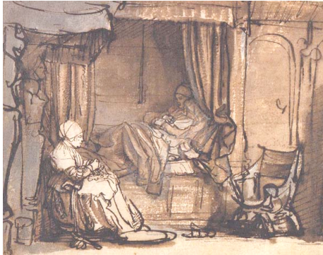
Rembrandt, 'Saskia in bed', ca. 1641, Fondation Custodia (Collectie Frits Lugt), Institut Néerlandais, Parijs

Rembrandt heeft zijn vrouw Saskia getekend terwijl zij in de bedstee van hun woon- en slaapkamer ligt. Saskia en Rembrandt kregen vier kinderen, waarvan er drie al na een paar weken overleden. Alleen zoon Titus bleef leven. Niet lang na de geboorte van Titus zou Saskia zelf overlijden.