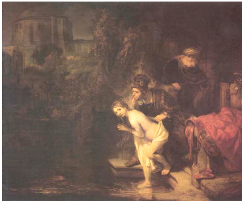
Rembrandt, 'Susanna en de twee oudsten', 1647, paneel, 76,5 x 92,8 cm, 1647, Gemäldegalerie, Berlijn

Rembrandt schilderde graag de meest dramatische momenten uit bijbelse verhalen. Aan de gezichten van de mensen die Rembrandt heeft geschilderd, kun je goed hun emotie aflezen. Bijvoorbeeld aan het gezicht van Judas die spijt heeft gekregen van zijn verraad van Christus, zie je hoe vreselijk wanhopig hij is. Je kunt ook bij de bijbelse Susanna, die heimelijk wordt belaagd door de 'oudsten', van het gezicht aflezen dat zij onschuldig en tegelijk doodsbang is. Rembrandt schilderde de emoties niet schreeuwerig, met grote gebaren. Je ziet het vooral aan de ogen en aan de rest van het gezicht. Toch is dat al voldoende. Je ziet iets van hun diepste gevoelens.