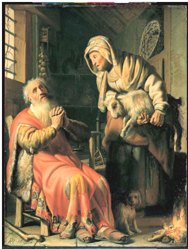
Rembrandt, 'Tobit en Anna', 1626, paneel, 40 x 29,9 cm., Rijksmuseum, Amsterdam

Met hun zwaarden tegen elkaar gehouden spreken de Bataven af dat zij in opstand zullen komen tegen de Romeinen. Rembrandt zet de figuren in het licht, tegen een donkere achtergrond. Hij maakt de figuren niet mooier dan ze waren: aanvoerder Julius Civilis mist zelfs een oog.