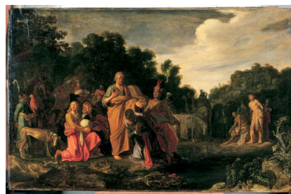
Boven: Pieter Lastman, 'De doop van de kamerling', ca. 1612, paneel, 62 x 100 cm. Collectie Frits Lugt, Instituut Néerlandais, Parijs