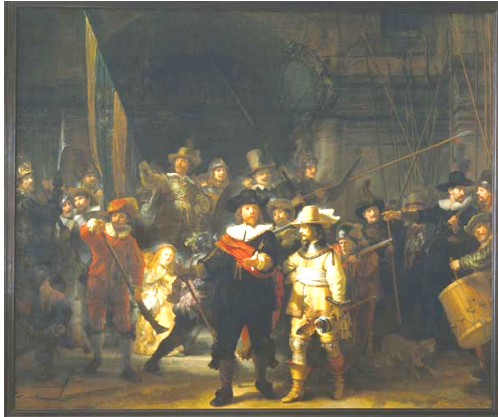
Rembrandt, 'De Nachtwacht', 1639-1642, doek 359 x 438 cm. Rijksmuseum, Amsterdam

Nachtwacht' voorgesteld. Alles ziet er heel levendig uit. Rembrandt heeft het zichzelf daarmee niet gemakkelijk gemaakt.