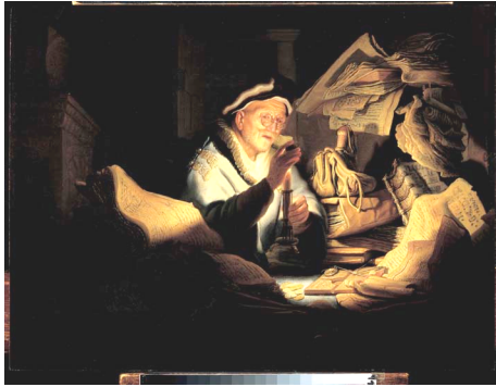
Rembrandt, 'Een oude woekeraar die een munt bekijkt', 1627, paneel, 31,9 x 42,5 cm. Gemäldegalerie, Berlijn

Een oude man zit tussen zijn stapels kasboeken, geldzaken, losse munten en goudstaafjes. Alles draait bij hem duidelijk om geld. Door een knijpbrilletje op zijn neus bestudeert hij een van zijn munten bij het licht van een kaarsvlam. Rembrandt weet een mooi contrast te maken tussen de door het goudgele kaarslicht belichte man met zijn spullen en de donkere ruimte om hem heen.