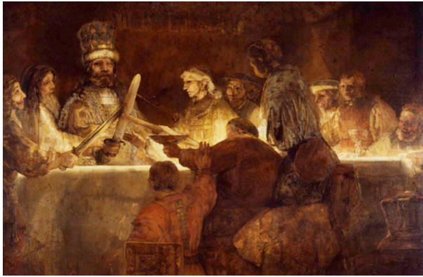
Rembrandt, 'De samenzwering van Julius Civilis', 1661, doek, 196 x 309 cm. Nationalmuseum, Stockholm

Met hun zwaarden tegen elkaar gehouden spreken de Bataven af dat zij in opstand zullen komen tegen de Romeinen. Rembrandt zet de figuren in het licht, tegen een donkere achtergrond. Hij maakt de figuren niet mooier dan ze waren: aanvoerder Julius Civilis mist zelfs een oog.