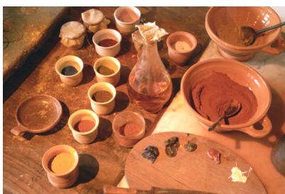
Potjes met pigmenten, een flesje olie en een palet met hoopjes verf: verfbereiding in Rembrandts atelier, Museum Het Rembrandthuis

Een doek of een paneel werd op een schildersezal gezet. Rembrandt hield een palet vast, waarop verf in kleine hoeveelheden klaar lag. In zijn andere hand hield hij zijn penseel. Olieverf kon je niet zomaar in een tube kopen. Je moest in het atelier verf maken. Je ging pigmenten (kleurpoeders) fijnwrijven en mengen met wat lijnolie. Je wreef met een platte steen op een wrijfplaat van gladde steen, net zolang totdat je olieverf had van de juiste dikte.