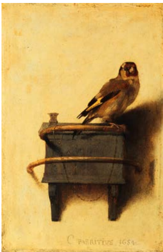
Carel Fabritius, Het puttertje , 1654, paneel, 33,5 x 22,8 cm, Mauritshuis, Den Haag

Een kudde koeien, schapen, een troep paarden met of zonder ruiters, kippen in een kippenren, allerlei kleurige vogels, of alleen één of twee dieren, zoals twee grote stieren, of een zwaan die zijn een nest verdedigt. Namen van kunstenaars die bekend zijn om hun schilderijen met dieren zijn: Paulus Potter, Melchior de Hondecoeter en Albert Cuyp.