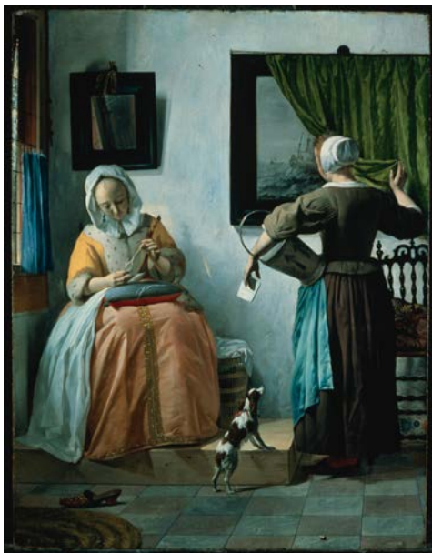
Gabriël Metsu, Een dame leest een brief terwijl haar dienstmeid naar een schilderij kijkt , ca. 1665, paneel, 52 x 40 cm, National Gallery of Ireland, Dublin

Buitenlanders die Nederland bezoeken in de 17 de eeuw verbazen zich vaak over de vele kunstwerken die ze hier in de huizen zien hangen. Het lijkt wel of iedereen een schilderijtje aan de wand heeft hangen!