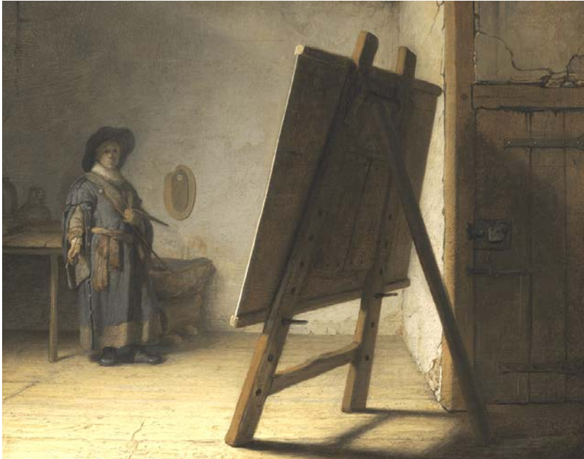
Rembrandt, Jonge schilder in zijn atelier , ca. 1629, paneel, 25 x 32 cm, Museum of Fine Arts, Boston

Soldaten, bakkers, kleermakers en apothekers, maar ook kaartenmakers, geografen en andere geleerden zie je druk bezig met het uitoefenen van hun beroep. De schilder zie je in zijn atelier, schilderend, nadenkend of in de weer met potentiële kopers en kunstkeners.