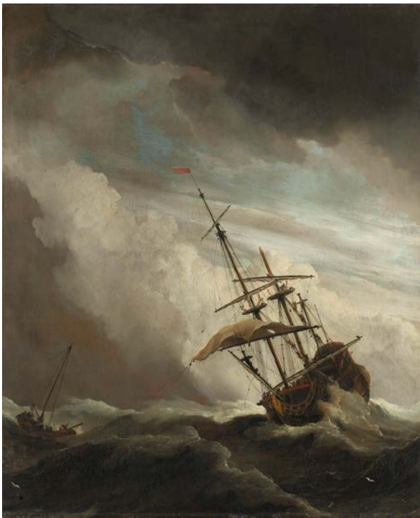
Willem van de Velde (II), Een schip in volle zee bij vliegende storm , bekend als De windstoot , ca. 1680, doek, 77 x 63,5 cm, Rijksmuseum

In 1672 treden vader en zoon Van de Velde in dienst van het Engels koningshuis, waar hun kundigheid op het gebied van de zeegezichten zeer hoog wordt gewaardeerd. Een van de bekendste Nederlandse zeeschilderijen is daarom niet van een Nederlands schip, maar van een Brits oorlogsschip op een woelige zee, gemaakt door Willem van de Velde junior.