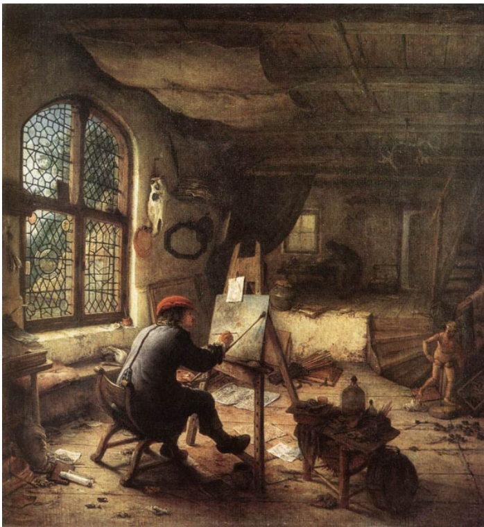
Adriaen van Ostade, Een schilder in zijn atelier , 1663, paneel, 38 x 35 cm, Gemäldegalerie Alte Meister, Dresden

Naast het grote aantal valt op dat al die schilderijen ook nog eens heel vakkundig zijn gemaakt. Hoe klein en eenvoudig ook, er zitten bijna geen slecht gemaakte exemplaren tussen. Naast een paar uitmuntende grote meesters, waren er hier dus een heleboel kleine meesters die goed werk afleverden, degelijk waren opgeleid en het vak in hun vingers hadden.