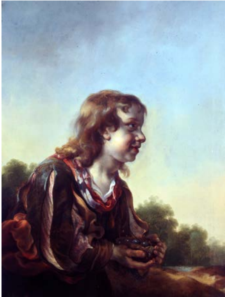
Jan van Noordt, Jongen met vogelnest , ca. 1659, doek, Museum Het Rembrandthuis