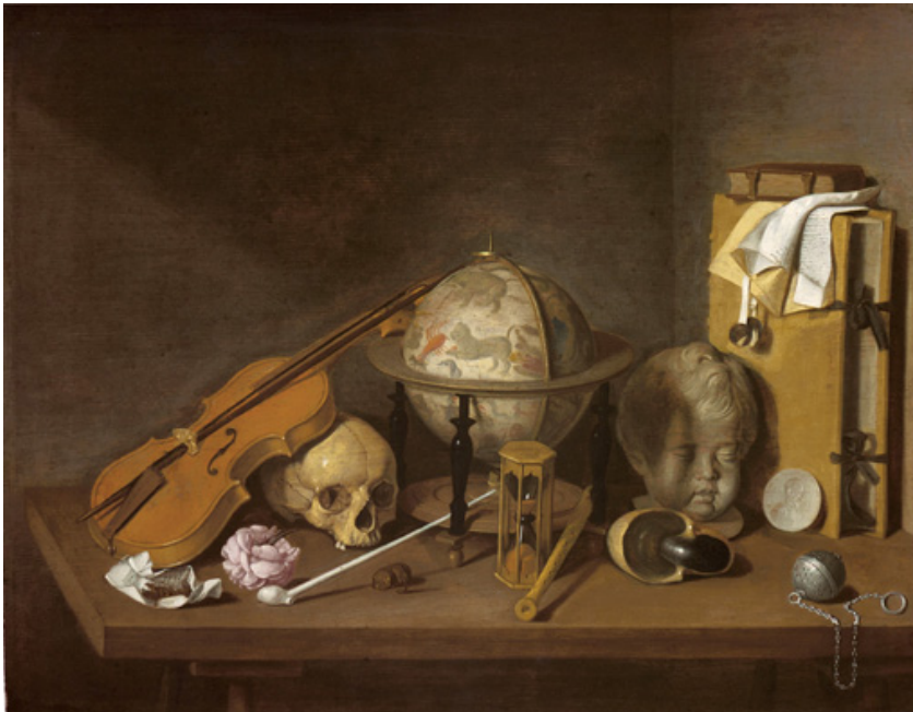
David Bailly, Vanitas stilleven , ca. 1640, paneel, 37,8 x 48,9 cm, Milwaukee, collectie van Alfred en Isabel Bader

Het klinkt erg somber allemaal. Maar je moet er wel bij bedenken dat ondanks de groeiende welvaart van Nederland in de 17 de eeuw, de dood nooit ver weg is. Hygiënische omstandigheden zijn vaak slecht en veel kinderen sterven al in het eerste levensjaar. Ziektes als tuberculose, syfilis en lepra komen overal voor, maar vooral in de dichtbevolkte steden, en epidemieën zoals de pest kosten vele mensenlevens.