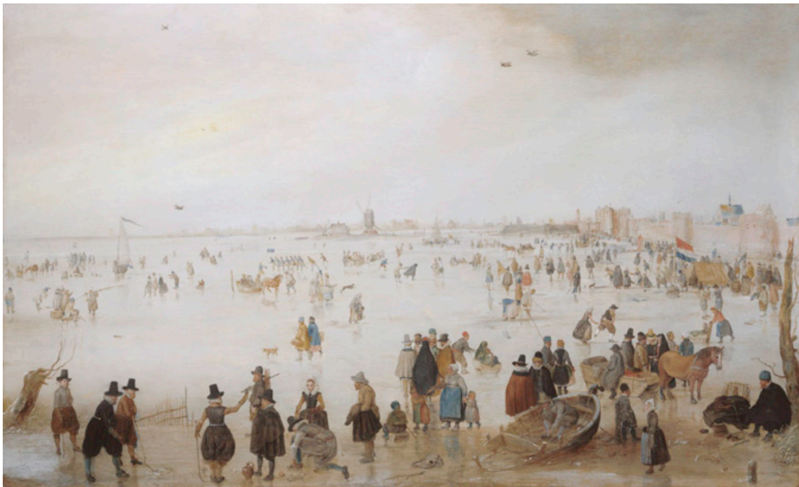
Hendrick Avercamp, Ijsgezicht bij de Broederpoort te Kampen , ca. 1620, paneel, 44,5 x 72,5 cm, particuliere collectie

Sommige kunstenaars gaan alleen maar landschappen schilderen, andere alleen maar stilleven. In de loop van de tijd kunnen ze daar heel goed in worden. Binnen de onderwerpen kun je je nog verder specialiseren, dus bijvoorbeeld alleen maar landschappen in de winter, of alleen maar stilleven met bloemen.