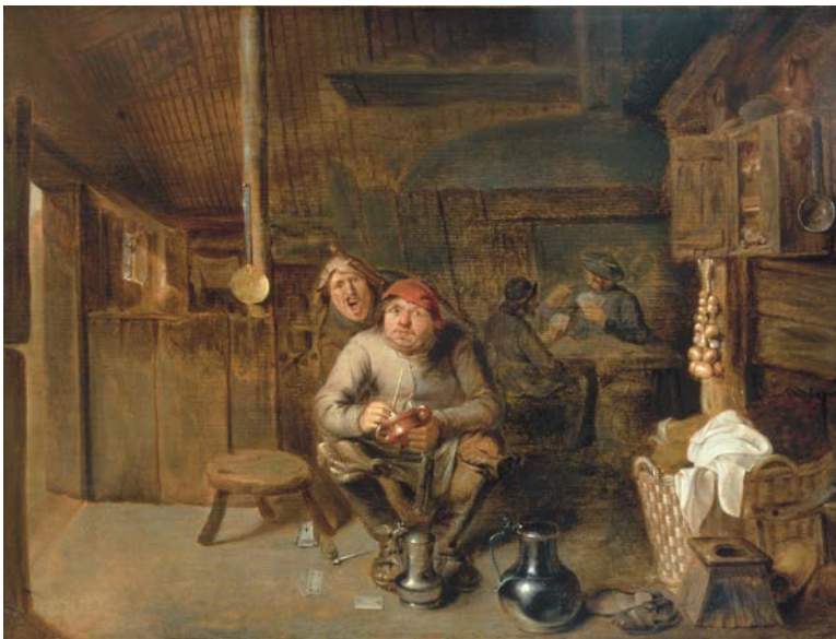
Pieter Duyfhuysen, Boerenherberg , ca. 1660, paneel, 39 x 51 cm, Kunsthandel Hoogsteder & Hoogsteder, Den Haag

Voor het ruwe boerenfolk kan flink te keer gaan in een herberg: ze drinken bier in grote hoeveelheden, roken de ene pijp na de andere, schreeuwen, dansen, vechten, om uiteindelijk laveloos op de grond te vallen. Wie zo'n voorstelling koopt, vindt het vermakelijk om naar te kijken, maar weet ook dat die boeren een slecht voorbeeld geven.