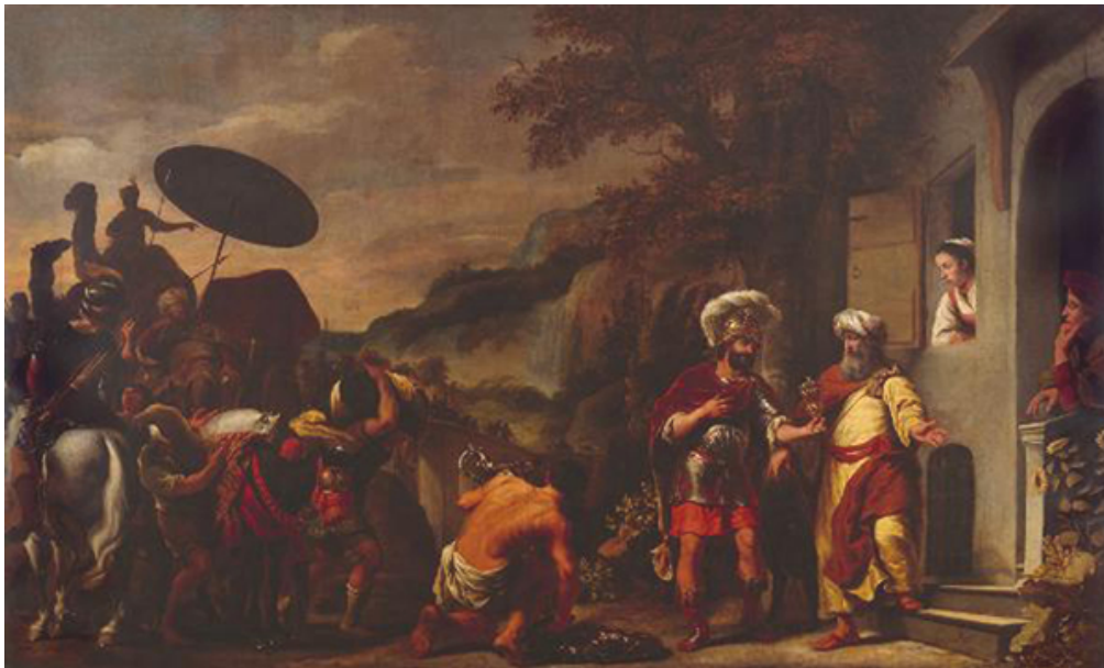
Ferdinand Bol, Elisa weigert de geschenken van Naäman , 1661, doek, Museum Het Rembrandthuis, bruikleen Amsterdam Museum

De hoofdpersonen zijn overdacht in het beeld geplaatst, als acteurs op een belangrijk moment uit het verhaal. Met sprekende gebaren laten zij zien wat hun rol in het verhaal is en ook hoe een goed mens hoort te handelen. De regenten kunnen daar een voorbeeld aan nemen voor hun eigen handelen.