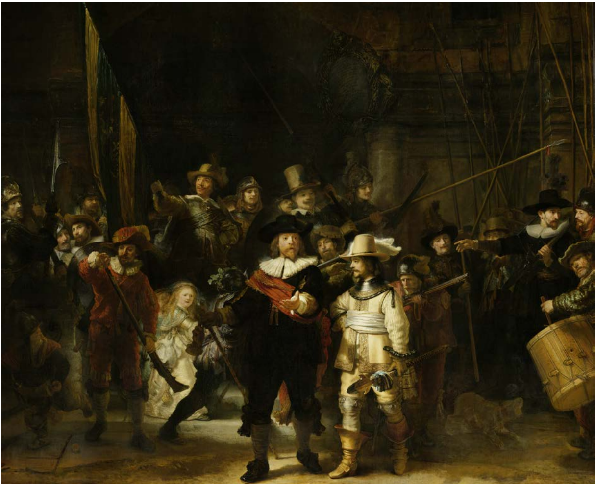
Rembrandt, De Nachtwacht , doek, 363 x 438 cm, Rijksmuseum

Je kunt een portret laten maken van jou alleen, of met z'n tweeën (bijvoorbeeld als echtpaar), maar je kunt er ook voor kiezen om een hele groep te laten portretteren. Dan noem je het een groepsportret (tegenwoordig wordt er dan meestal een groepsfoto gemaakt). Dat kan bijvoorbeeld zijn als familie of als lid van een bepaalde beroepsgroep. Schutters (die de orde moesten bewaken in een stad en de stad tegen vijanden moesten verdedigen) hebben vaak groepsportretten laten maken. Denk maar aan het beroemdste groepsportret: Rembrandts Nachtwacht, eigenlijk de schutterscompagnie van kapitein Frans Banning Cocq en luitenant Willem van Ruytenburgh. Rembrandt heeft ervoor gekozen om niet iedereen stijf op een rijtje te portretteren, maar beweeglijk: ergens mee bezig, lopend en druk gebarend, alsof het maar een moment is dat zo weer voorbij is.