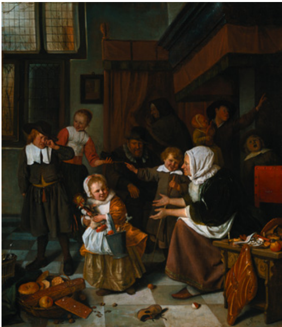
Jan Steen, Het Sinterklaasfeest , ca. 1665, doek, 82 x 70,5 cm, Rijksmuseum

Je ziet een mensen in hun bezigheden thuis, bij een bijzondere gelegenheid (bijvoorbeeld een feestmaal of bij het Sinterklaasfeest) of alleen maar gewoon de vloer schoon vegend, met potten en pannen in de weer, lezend, muziek makend, de haren kammend, enzovoort.