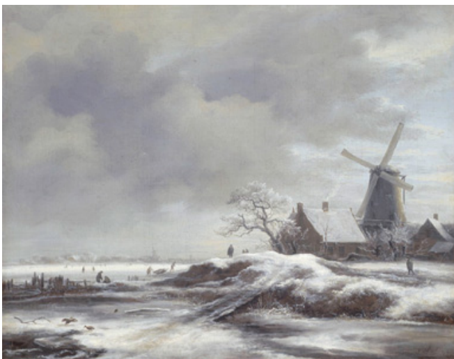
Jacob van Ruisdael, Winterlandschap met molen , doek, 37,3 x 46 cm, Fondation Custodia, Parijs

In de 17 de eeuw zijn de winters meestal zeer streng. Er is zelfs wel sprake van 'een tweede ijstijd'. Sommige kunstenaars raken erdoor geïnspireerd: ze willen het Nederlandse landschap afbeelden met sneeuw en ijs en alle bezigheden die daarbij horen. Als je naar hun schilderijen kijkt, zie je het plezier van het schaatsen, maar je kunt ook de ijzige koude wind voelen, die giert over het besneeuwde, vlakke landschap.