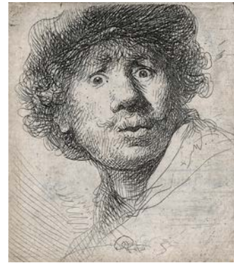
Rembrandt, Zelfportret met verbaasde blik , 1630, ets, 5 x 4,6 cm, Museum Het Rembrandthuis