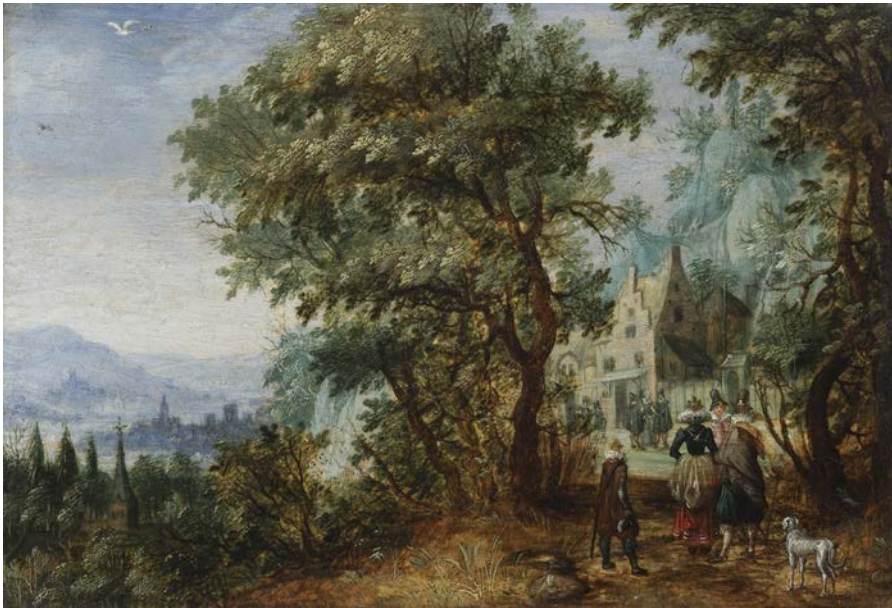
David Vinckboons, Zomerlandschap , ca. 1610, paneel, 10,5 x 15,5 cm, collectie Frits Lugt, Fondation Custodia, Parijs

tot hoofdonderwerp durven maken, zijn zij die series maken van schilderijtjes over de seizoenen: de lente, zomer, herfst en winter.