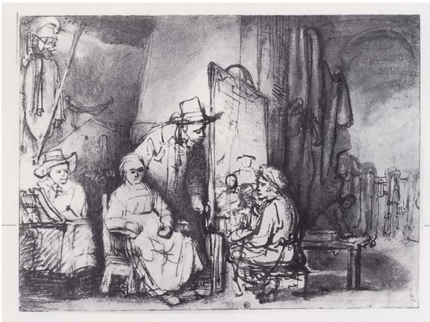
Samuel van Hoogstraeten, Een schildersatelier , ca. 1640, pentekening, 17,5 x 23,4 cm, Musée du Louvre, Parijs

Er zijn in die tijd ook een paar kunsttheoretici die boeken schrijven waarin ze handige regels voor beginnende kunstenaars opstellen. Samuel van Hoogstraeten is zo'n kunsttheoreticus. Hij is oorspronkelijk schilder, zelfs opgeleid bij de beroemde Rembrandt van Rijn.