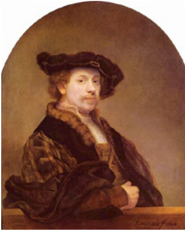
Rembrandt, Zelfportret , 1640, doek, 93 x 80 cm, National Gallery, Londen

Op een portret van zichzelf kan een schilder zich formeel afbeelden als succesvolle kunstenaar, maar ook informeel, als iemand die met veel expressie boos, vrolijk of verbaasd in de spiegel kijkt. De beste voorbeelden van die laatste soort vind je niet bij de schilderkunst, maar bij de prentkunst, met name de etsen van Rembrandt.