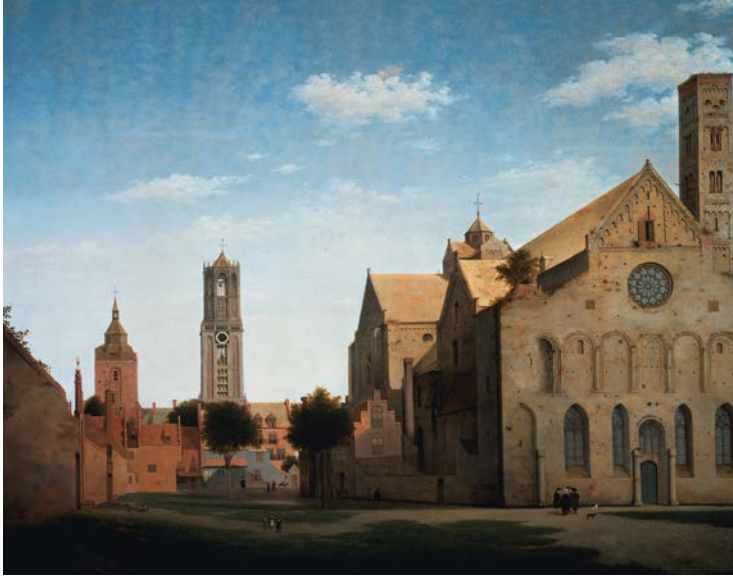
Pieter Saenredam, De Mariaplaats en Mariakerk in Utrecht , 1662, paneel, 109,5 x 139,5 cm, Museum Boijmans Van Beuningen, Rotterdam

Stadsgezichten, grote gebouwen als poorten, stadhuisen en kerken (zowel de buitenkant als het interieur), waarbij mensen soms klein zijn weergegeven, zodat de gebouwen extra indrukwekkend lijken. Er zijn maar weinig kunstenaars geweest die zich op dit gebied hebben bekwaamd; dat zijn bijvoorbeeld: Pieter Saenredam, Emanuel de Witte en Gerrit Berckheyde.