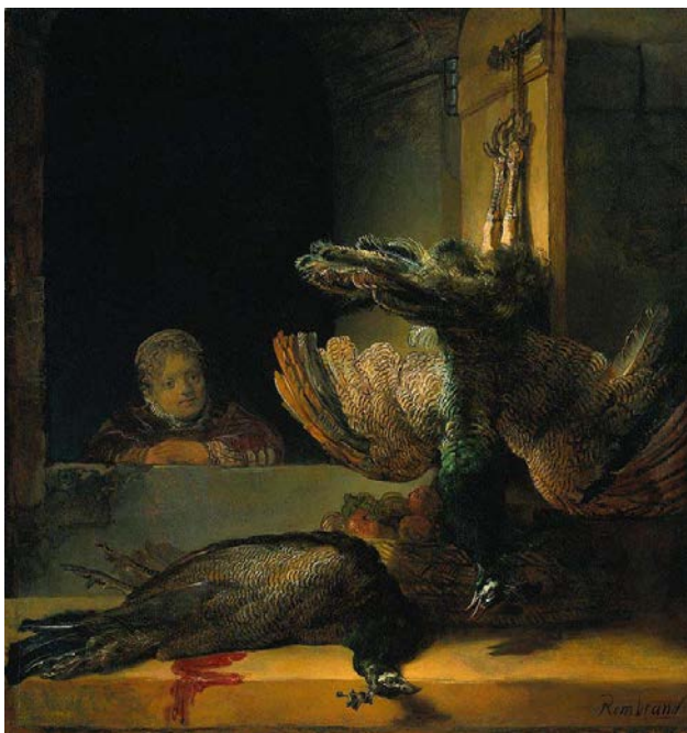
Rembrandt, Meisje met dode pauwen , 1639, doek, 145 x 135,5 cm, Rijksmuseum

Gedode dieren liggen klaar om bereid te worden voor een maaltijd. Zo liggen vissen op marktkramen. Afgeschoten wild en gevogelte hangt in een voorraadruimte.