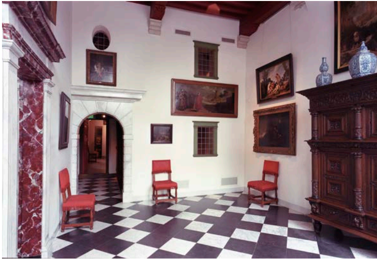
Het Voorhuys in het Rembrandthuis

In de voormalige woning van Rembrandt zijn genoeg kunstwerken tentoongesteld om een beeld te krijgen van het ruime aanbod aan genres in de kunst van de 17 de eeuw. Leerlingen kunnen op meerdere manieren in het museum voorbeelden van verschillende genres gaan bekijken.