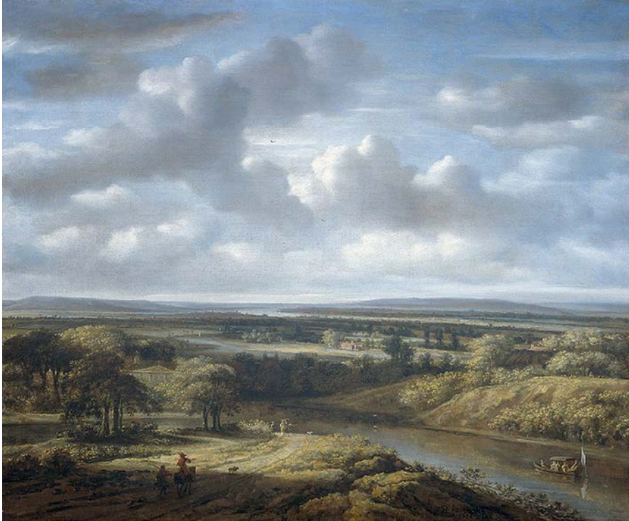
Philips Koninck, Rivierlandschap , 1676, doek, ca. 89 x 109 cm, Museum Het Rembrandthuis, bruikleen Rijksmuseum