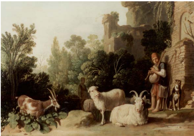
Claes Cornelisz Moeyaert, Landschap met ruïnes en vee , ca. 1625, doek, ca. 32 x 46 cm, Museum Het Rembrandthuis

Dit is niet typerend voor de Nederlandse kunst. Toch heeft een klein aantal kunstenaars zich beziggehouden met het weergeven van het geïdealiseerde landschap. Je ziet een paradijselijke omgeving met herders en hun beesten. Er heerst een serene rust. Zulke voorstellingen zijn vaak verbeeldingen van gedichten die het eenvoudige landleven verheerlijken.