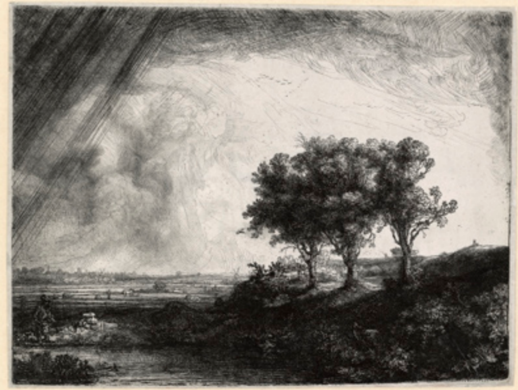
REMBRANDT, DE DRIE BOMEN, 1643, ETS, REMBRANDTHUIS