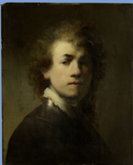
REMBRANDT, ZELFPORTRET MET METALEN KRAAG, 1629, SCHILDERIJ, GERMANISCHES NATIONALMUSEUM, NEURENBERG