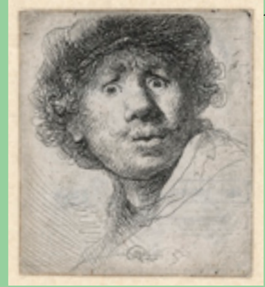
REMBRANDT, ZELFPORTRET MET VERBAASDE BLIK, 1630, ETS, REMBRANDTHUIS

Heb je wel eens goed gekeken naar het gezicht van iemand die verbaasd is? In dit kleine zelfportret van Rembrandt (het is maar zo'n 5 cm hoog en 4 cm breed) kun je zien wat er dan met je gezicht gebeurt. De ogen staan wijd open, de mond krijgt de vorm van een 'o'. Rembrandt wilde leren hoe je zo'n uitdrukking moest tekenen. Hij heeft ook veel geoeft om bijvoorbeeld lachende of boze gezichten goed te kunnen tekenen. Na jaren oefenen blonk Rembrandt uit in het tekenen en schilderen van gevoelens.