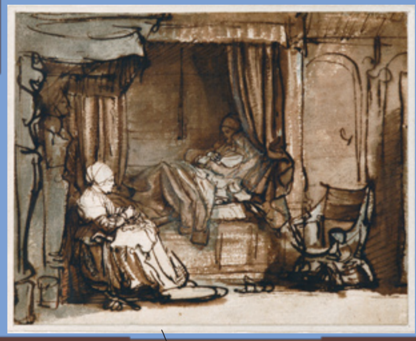
REMBRANDT, SASKIA IN BED, 1641, PENTEKENING, FONDATION CUSTODIA, COLLECTIE LUGT, PARIJS

Dit is de huiskamer van Rembrandt en zijn gezin. Je noemde dat toen de 'zaal' en je schreef dat als 'Sael'. Zie je het bed in de kast? Dat noem je een bedstee. Een bed in de huiskamer was normaal in die tijd. Een aparte slaapkamer had bijna niemand. Rembrandt heeft in de Sael gezeten toen hij deze tekening maakte. Herken je dingen van de foto die je ook op de tekening ziet? In de bedstee zie je Saskia en in de stoel zit een dienstmeisje dat haar gezelschap houdt. Het was toen een verdrietige tijd voor Rembrandt. Saskia, waar hij zoveel van hield, werd ziek en ze overleed toen ze nog maar 29 jaar was!