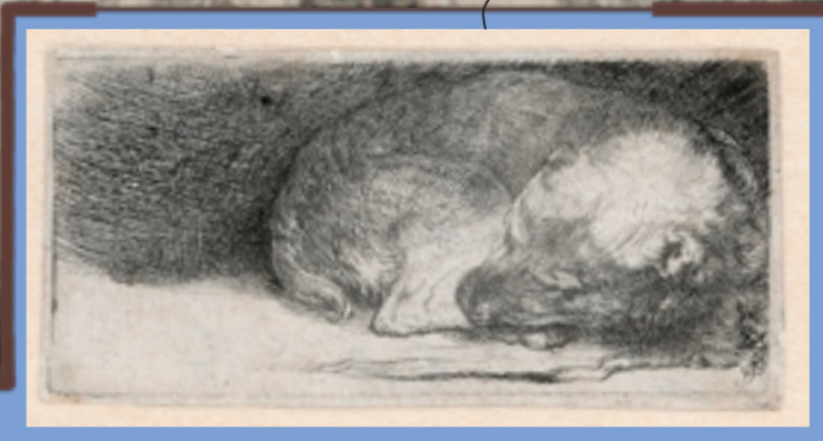
REMBRANDT, SLAPEND HONDJE, 1640, ETS, REMBRANDTHUIS

In deze kamer drukte Rembrandt zijn prachtige etsen af. Tegenwoordig is Rembrandt vooral beroemd door zijn schilderijen, maar tijdens zijn leven werden vooral zijn etsen bewonderd. Maar wat is een ets eigenlijk? Bij een ets maak je met een etsnaald een tekening in een metalen plaat. Je maakt met bijtend zuur groeven in het metaal die je met inkt op papier afdruckt. Voor het afdrukken gebruik je een zware etspers, die de inkt uit de groeven op het papier drukt.