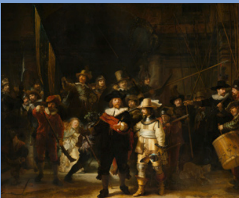
REMBRANDT, DE NACHTWACHT, 1642, SCHILDERIJ, RIJKSMUSEUM

Weet je wie de man op dit schilderij is? Het is de beroemde schilder Rembrandt van Rijn. Hij heeft zichzelf geschilderd; dat noem je een zelfportret. Het grote schilderij hieronder ken je vast beter: het is Rembrandts bekendste kunstwerk: De Nachtwacht. Rembrandt leefde wel 400 jaar geleden. Toen hij deze schilderijen maakte, was hij al beroemd, niet alleen in eigen land, maar ook zelfs in andere landen, zoals Italië. Nu is hij beroemd over de hele wereld! Want jaarlijks komen duizenden mensen vanuit een heleboel landen kijken naar De Nachtwacht. Rembrandt heeft meer dan 300 prachtige schilderijen gemaakt. Elk museum wil wel een 'echte Rembrandt' hebben. Heb jij ooit eens een schilderij van Rembrandt in het echt gezien?