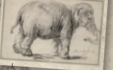
REMBRANDT, OLIFANT, ZWART KRIJST, 1641, ALBERTINA, WENEN

Op de markt, in een circustent, was gisteren voor de eerste keer in Nederland een echte olifant te zien. Het publiek keek zijn ogen uit naar het grote dier, maar er gebeurde iets wat de verbazing nog groter maakte. Een vrouw uit het publiek riep dat haar riem was gestolen. De olifant, die Hansken wordt genoemd, snuffelde met haar slurf aan de mensen in het publiek. Zij sloeg met haar slurf op het hoofd van een man. Deze liet de riem vallen en probeerde hem onopvallend weg te schuiven. Dat lukte niet en hij moest wel bekennen. Hansken kreeg als beloning lekkere koekjes van de vrouw! Rembrandt heeft deze tekening gemaakt van Hansken.