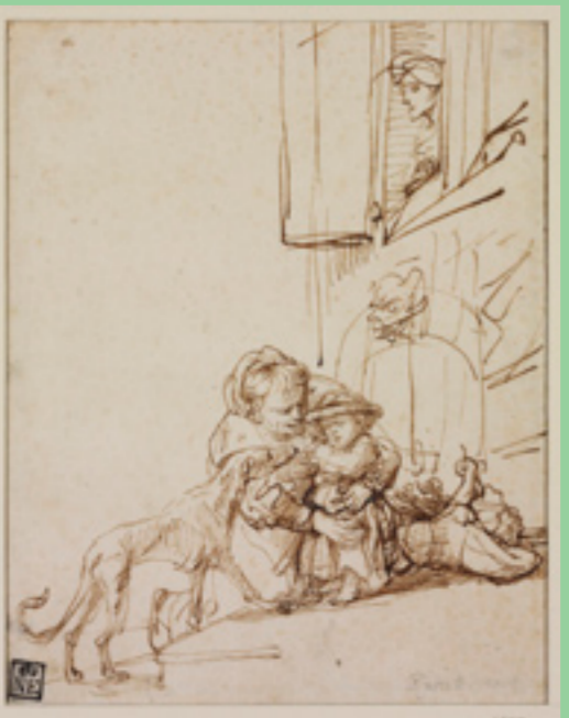
REMBRANDT, VROUW MET KIND DAT VAN EEN HOND SCHRIJKT, 1636, PENTEKENING, MUSEUM VOOR SCHONE KUNSTEN, BOEDAPEST

Het is alsof je de vrouw hoort zeggen: "Rustig maar, de hond doet niks". Maar je ziet aan het gezicht van het kleine kindje dat het nog bang is, hoe wel de hond er toch lief uitziet. Het is maar een moment, alles gebeurde snel. En het kostte Rembrandt misschien maar een paar minuten om deze tekening te maken. Hoe snel Rembrandt ook tekende, steeds wist hij een mens of een dier direct goed te treffen. Elke lijn is precies zoals die moest zijn. Geen lijn teveel... Hij heeft dat zo knap gedaan, je ziet het zo voor je gebeuren!