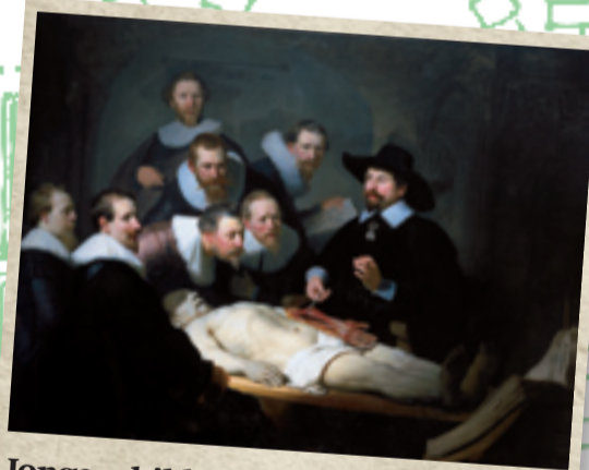
REMBRANDT, DE ANATOMISCHE LES VAN DR. NICOLAAS TULP, 1632, SCHILDERIJ, DEN HAAG, MAURITSHUIS

De kinderen op deze foto staan voor een bijzonder huis in Amsterdam. Rembrandt woonde en werkte er wel bijna twintig jaar. Nu is het een museum: Museum Het Rembrandthuis. De kinderen gaan er op bezoek. Als je het huis binnenloopt, lijkt het wel of je in een tijdmachine terecht komt en de 17de eeuw instapt. Je zou je kunnen voorstellen dat je Rembrandt daar tegenkomt. Je loopt door de kamers waar hij met zijn vrouw Saskia en zoon Titus leefde. Het is een echt kunstenaarshuis, want de meeste kamers zijn ingericht om het beroep van kunstenaar te kunnen uitoefenen. Je komt in het atelier waar hij veel van zijn beroemde schilderijen heeft gemaakt, en in Rembrandts schatkamer: een kamer vol mooie spullen die hij gebruikte om na te tekenen of te schilderen. Als je meer hierover wilt lezen, kijk dan op pagina 2. Het Rembrandthuis is vooral een bijzonder museum omdat je er niet alleen dingen kunt bekijken, maar ook van alles kunt doen. Kijk maar eens op pagina 4 wat je er kunt doen als je met je klas op bezoek komt.