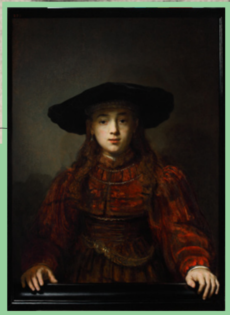
REMBRANDT, MEISJE IN EEN SCHILDERIJLIJST, 1641, KONINKLIJK KASTEEL, WARSCHAU

Rembrandt heeft dit meisje vast precies verteld hoe ze moest gaan staan: "Het moet lijken alsof de schilderijlijst een vensterbank is. Je leunt met je linker hand net over de rand. De andere hand moet net boven de rand zweven, alsof je bezig bent hem erop te leggen." Dat heeft hij precies zo geschilderd. Je ziet de schaduw van de vingers, de hand ligt nog niet op de rand. Het lijkt alsof ze echt, door de schilderijlijst heen, naar je toe komt. Dat is wat Rembrandt wilde.